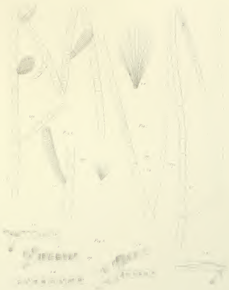
Fig. 1. Ectocarpus Duchassaingianus Grun.