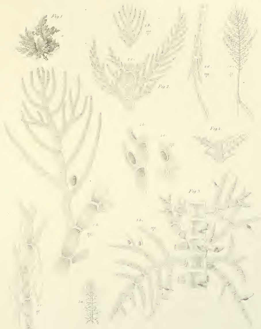
Fig. 1. Callithamnion Pennula Grun.