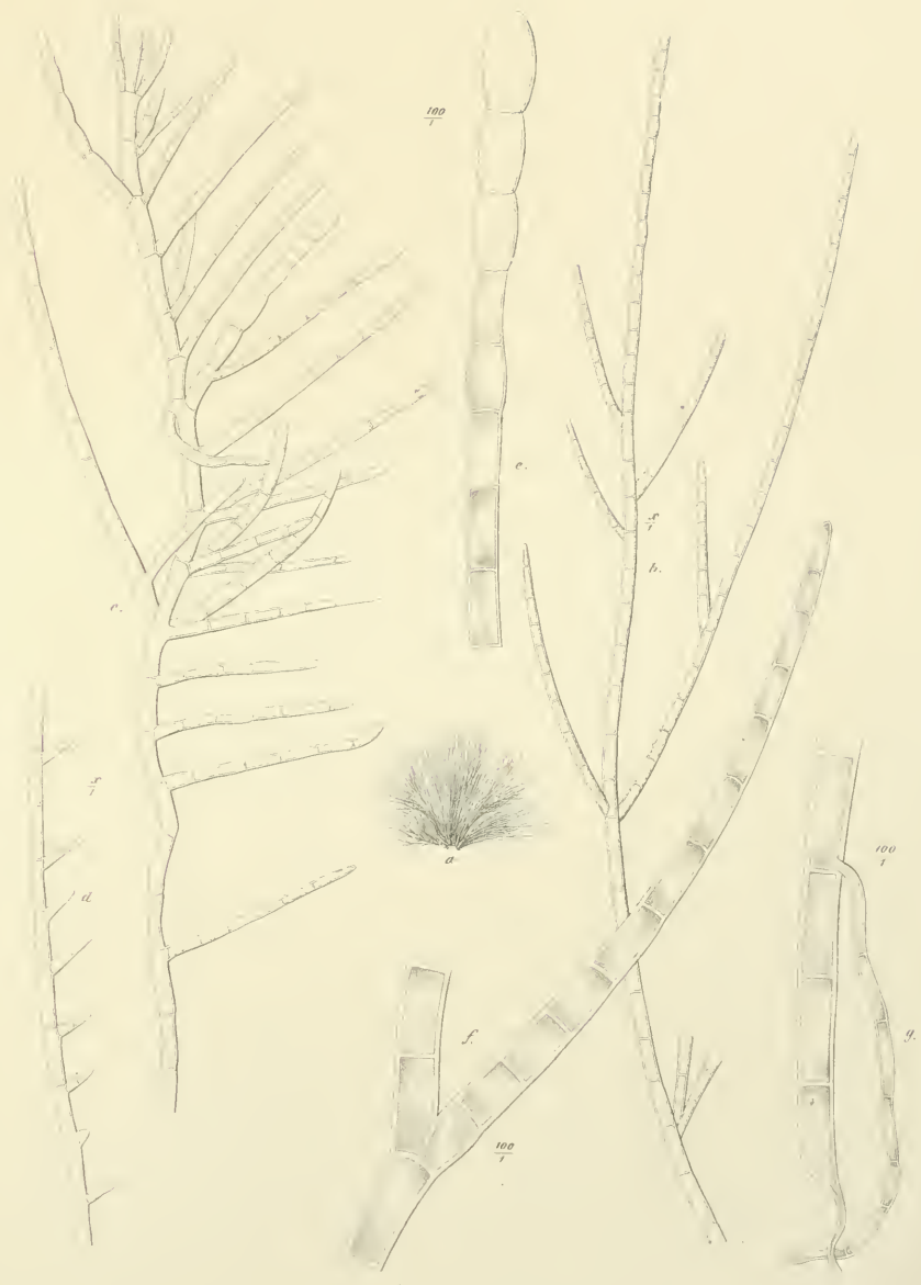
Padophora (Spongomorpha) pectinella Grun.