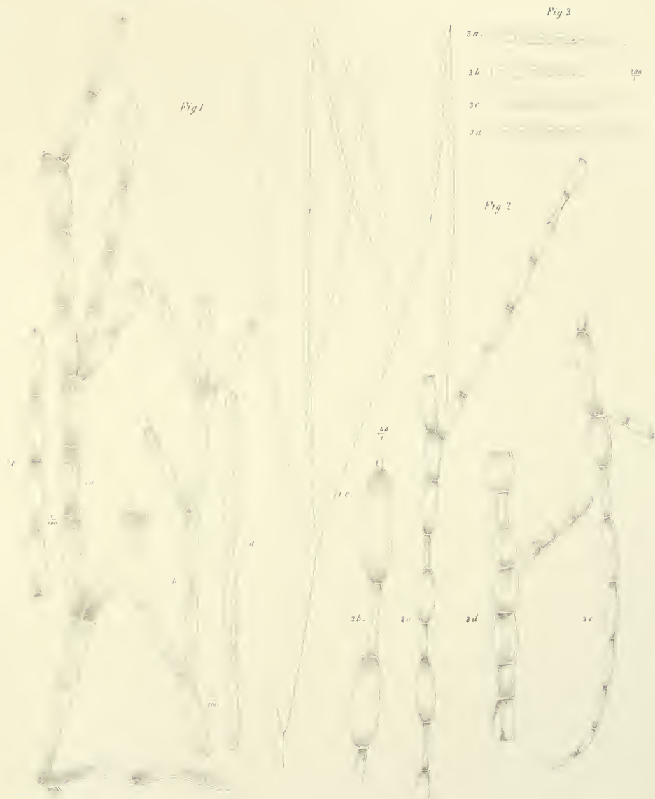
Fig. 1. Cladophora Hochstetteri Gr. Fig. 2. Cladophora chartacea Gr. Fig. 3. Glauclita capensis Gr.